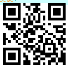
【緊急連絡用HPアドレス：QRコード】

第1条 生徒が登校する以前に暴風警報が発令されている場合、次のいずれかの処置をとる。↓ (1) 始業時刻の2時間前までに解除された場合は平常授業を行う。↓ (2) 始業時刻の2時間前より、午前11時までに解除された場合は、解除後2時間を経過してから、授業を開始する。↓ (3) 午前11時以降解除された場合は、臨時休校とする。↓ (4) 上記の1、2の場合においても、道路、橋の損壊などで危険な場合や、交通機関の停止、自家の被害の著しい場合には、登校するには及ばない。↓ 第3条 暴風以外の災害には、その都度、校長が判断をして適切な措置をとる。↓ 第4条 道路、橋の損壊などで、危険な場合や、交通機関の停止、自家の被害の著しい場合には、登校しなくてもよい。↓ 注) 遠隔地の者は、災害時帰宅できない場合に、宿泊できる場所(親戚・知人宅等)をあらかじめ定めておくこと。(住所・氏名・電話番号・生徒との関係など)↓ 親戚・知人などのない者は、その旨をあらかじめ学級担任に届けておくこと。↓ ①戻る